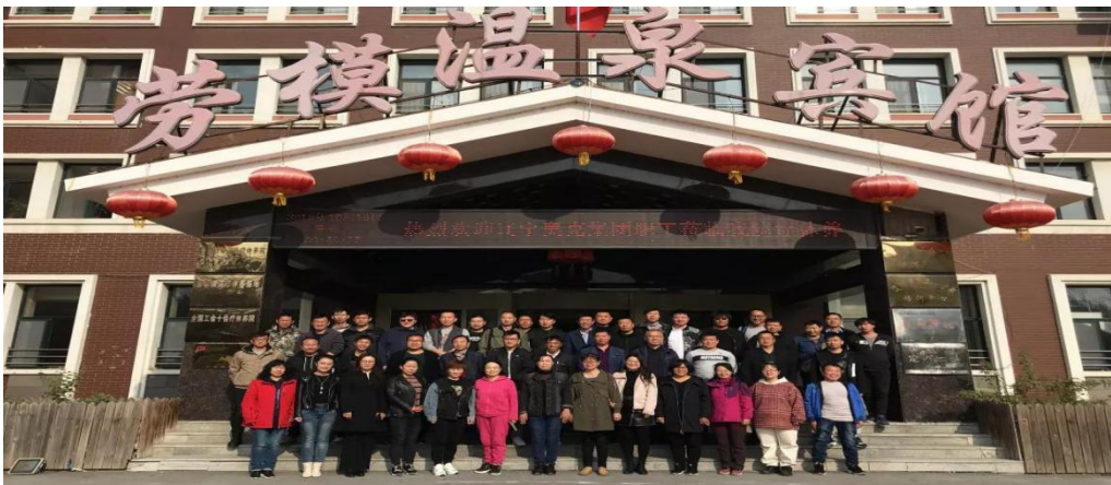
图 1、9 月 13 日，公司慰问子公司江苏奥克化学有限公司、扬州石化仓储有限公司中秋节加班员工 2、组织一线职工进行疗休养。