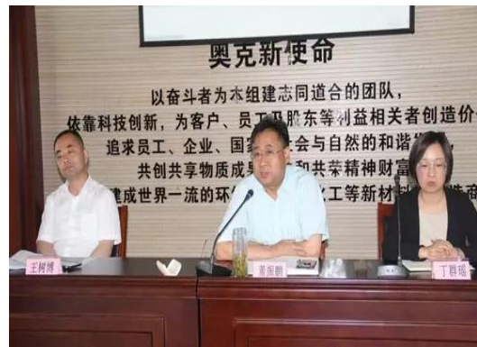
图：5 月 14 日，公司召开绩效激励体系建设启动会。