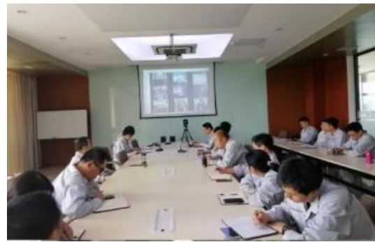
图：1、5月29日，江苏奥克化学有限公司组织对整个生产区进行全面性检查； 2、3、5月29日，公司及子公司组织召开“2019年安全生产月启动会”。