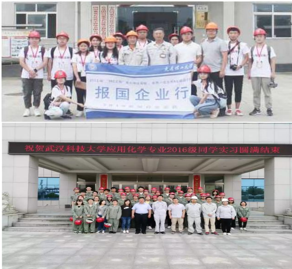
图 1、大连理工大学到子公司四川奥克化学有限公司参观实习；