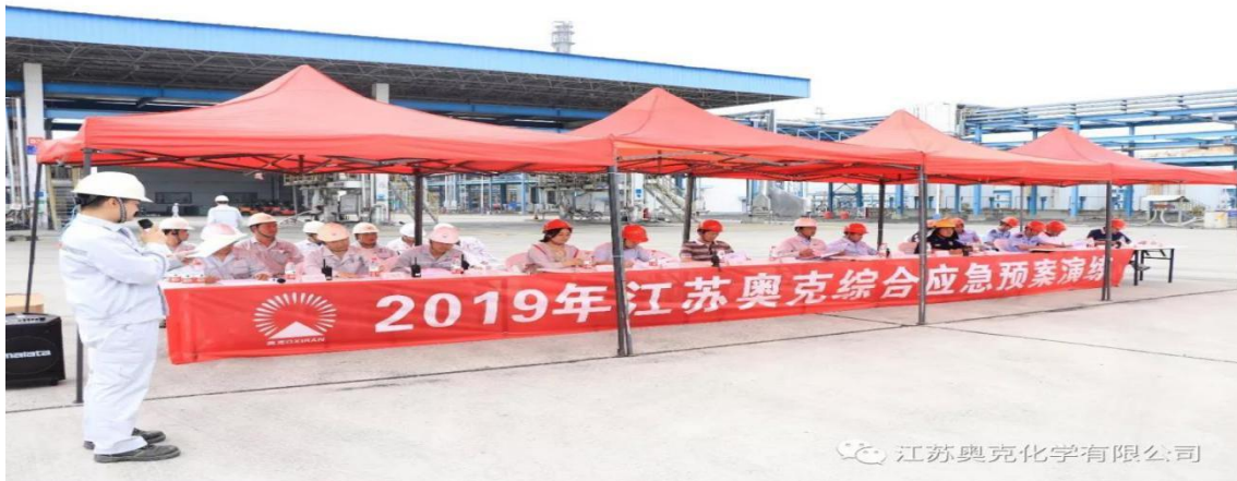
图 1、4 月 4 日，扬州市工会领导检查江苏奥克化学有限公司生产厂区安全情况；