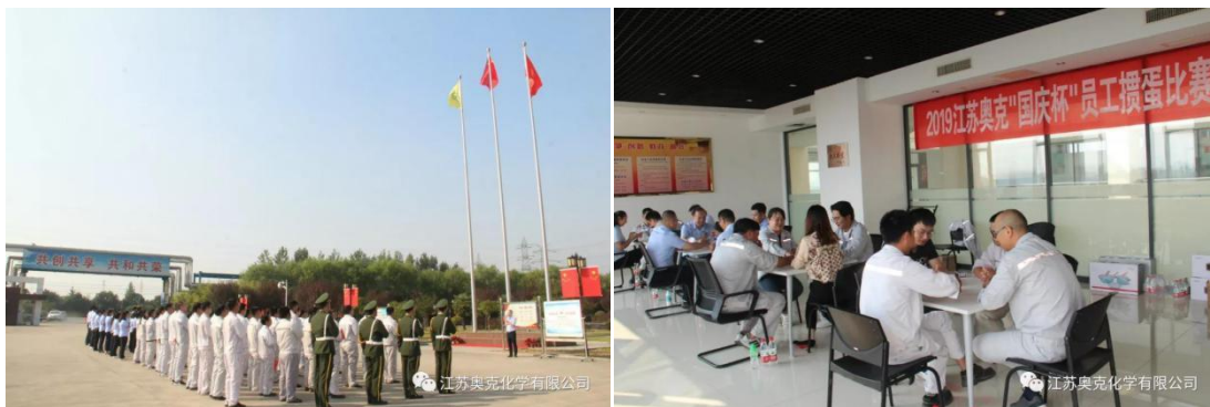
图 1、9 月 28 日，公司、子公司江苏奥克化学有限公司、扬州奥克石化仓储有限公司联合举办“庆国庆、庆厂庆”升旗仪式；2、子公司江苏奥克化学有限公司举办“国庆杯”员工擀蛋比赛。

自奥克成立以来，文化建设在奥克发展历程中一直是不可或缺的一部分。2019 年分别于 9 月、12 月开展首届青管班第一期、第二期培训活动，第一期培训以“文化聚人”为主题，学员们重温奥克文化并加深理解，进一步提高公司的凝聚力和战斗力；第二期培训以“战略制胜”为主题，学员们系统性的学习了公司成立以来的战略，为公司将来战略的制定和践行奠定坚实基础。