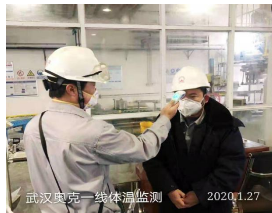
图：1、奥克积极响应国家号召，切实履行社会责任；