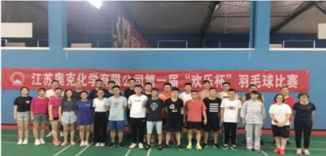
图：1、全资子公司上海奥克贸易发展有限公司员工旅游活动； 2、全资子公司江苏奥克化学有限公司员工旅游活动； 3、全资子公司江苏奥克化学有限公司组织员工进行羽毛球比赛。