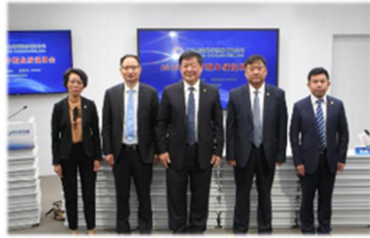
图：9月4日，公司在上海成功举办2019年度中期业绩说明会。