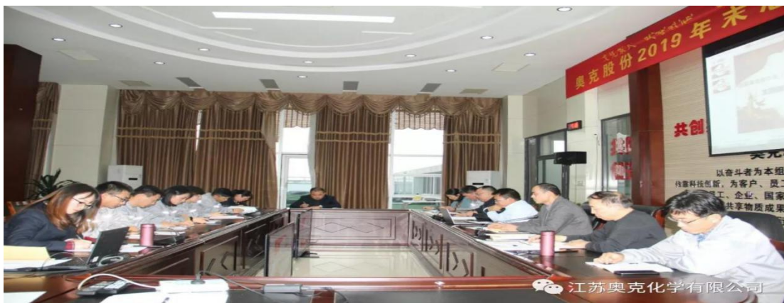
图 1、11 月 12 日，党委组织召开“不忘初心、牢记使命”主题教育专题党课；

2、11 月 12 日，子公司江苏奥克化学有限公司召开科学技术协会成立暨第一次会员大会；