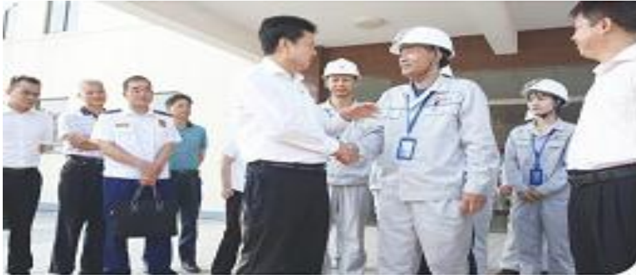
图：9月26日，广东省茂名市副市长一行到访全资子公司广东奥克化学有限公司。

化学有限公司在安全生产和创新发展工作方面管理规范、制度齐全、亮点突出，取得的卓著成效，值得其他企业学习借鉴。